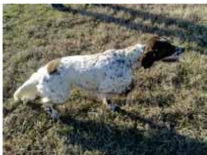
Luna di Piero Terrosi